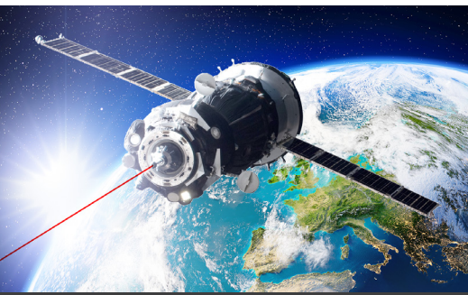
Arbeiten für die Branchen der Zukunft